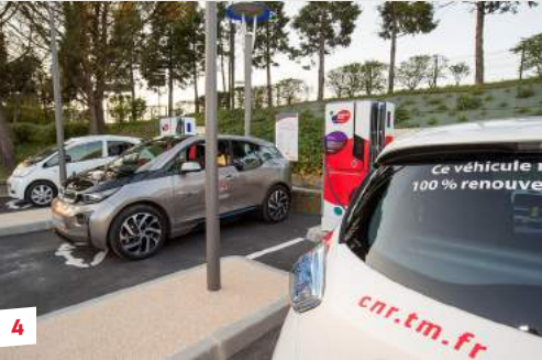
4 Réduire notre empreinte carbone

CNR systématise la prise en compte de ses émissions de gaz à effet de serre dans le développement de ses projets et son fonctionnement quotidien, quels que soient ses métiers. Encourager la sobriété énergétique de ses collaborateurs, se doter d'une flotte de véhicules 100 % décarbonés et réduire son empreinte numérique font partie de ses priorités.